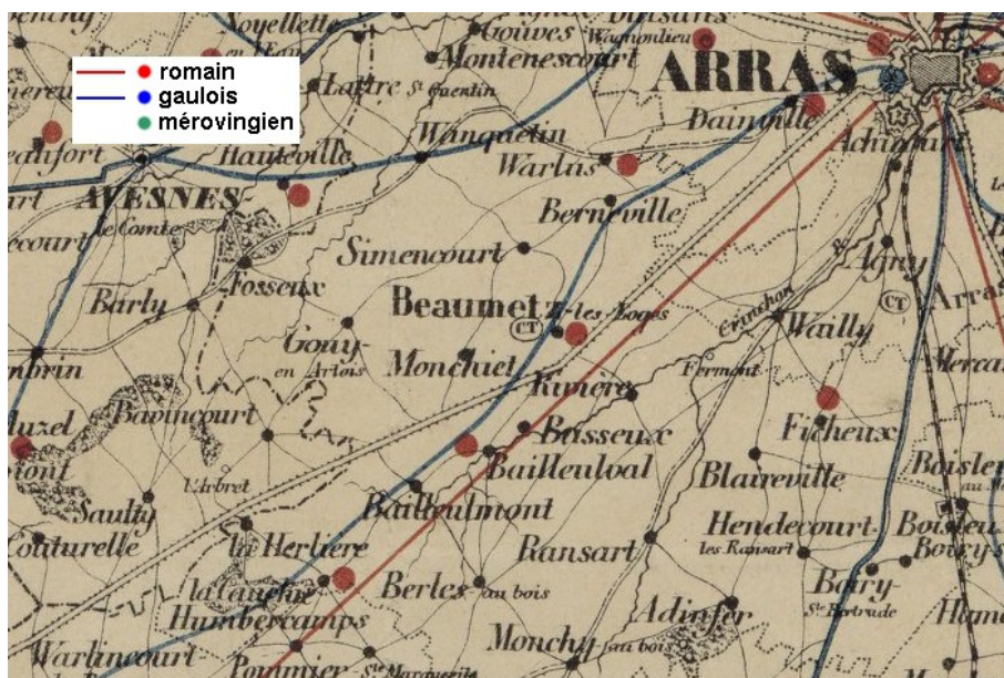
Carte de A Therninck reprenant les sites de découvertes et les voies de communication gauloises et romaines.

En 1909, le journal LA LANTERNE relate la découverte de squelettes humains et de poteries, probablement de l'époque Gallo-romaine, sur le territoire de Bavincourt.